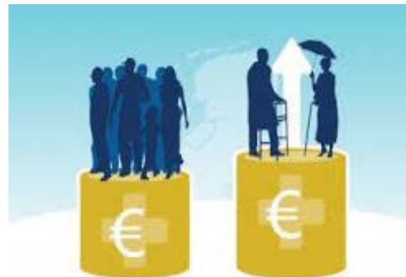
Maatschappelijke druk door de demografische evolutie.

en willen actief op zoek naar alternatieven voor brugpensioen of herstructureringen.