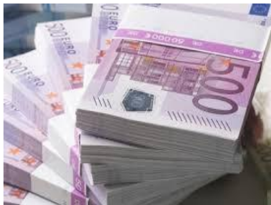
Hoge kosten voor de organisatie zelf.

Ook bedrijven zien in dat vervroegde uitredingen niet meer haalbaar zijn omwille van: